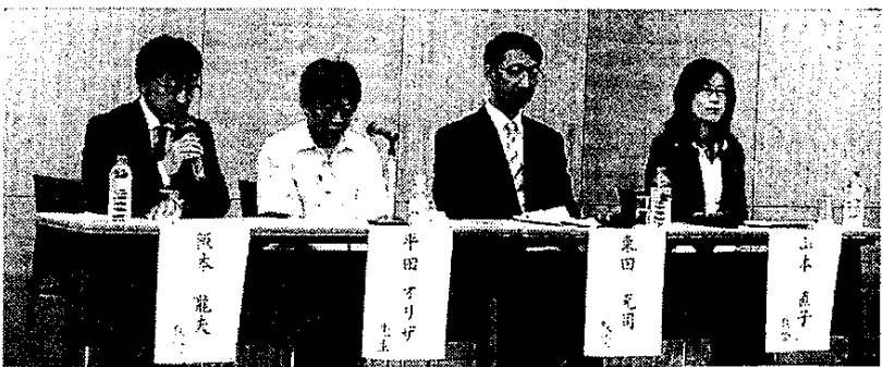
平田オリヂ氏を招いた大牟前ホールでの講演会

室があり、24名から最大400名まで収容可 はじめ、オフィスの会議や研修など、一般の方 けます。 きまして、お電話にてお問い合わせください。